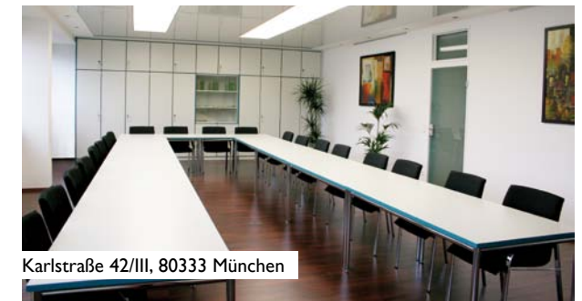
Karlstraße 42/III, 80333 München

Noch besser: Schauen Sie doch einfach mal bei uns rein. Wir freuen uns auf Ihren Besuch.