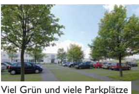
Viel Grün und viele Parkplätze